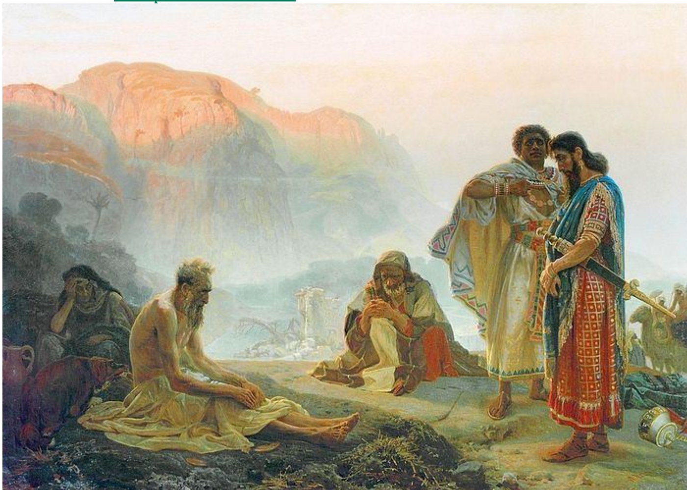
И. Репин. Иов и его друзья. 1869 г.